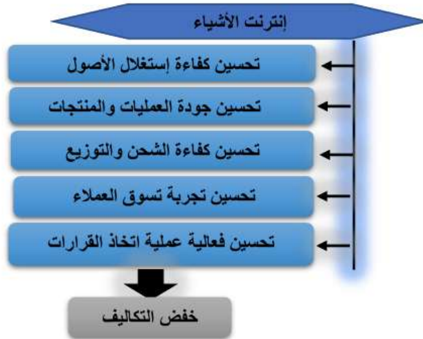
شكل رقم (1): دور إنترنت الأشياء في خفض التكاليف