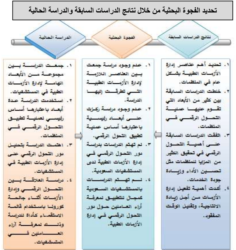
شكل رقم (١-١) الفجوة البحثية